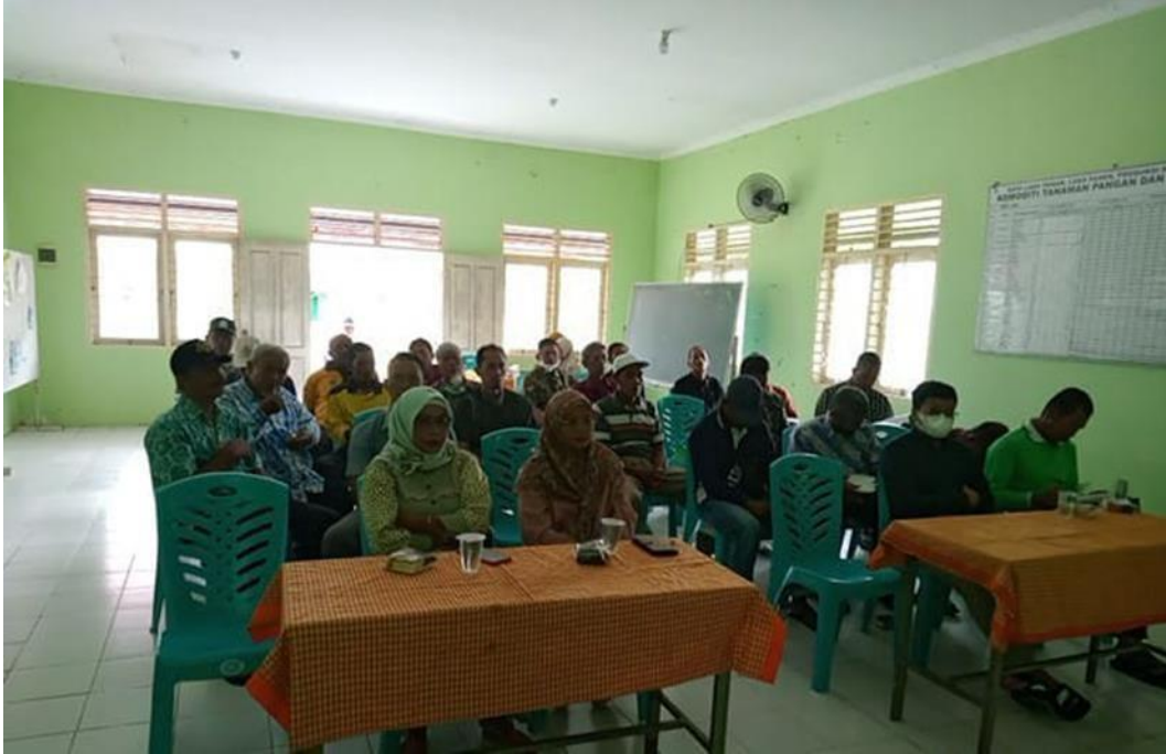
Foto. Kegiatan Penyuluhan Dalam Rangka Peningkatan Pengetahuan Petani